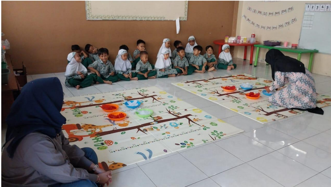
Lampiran 1. Gambar Kegiatan Belajar Mengajar