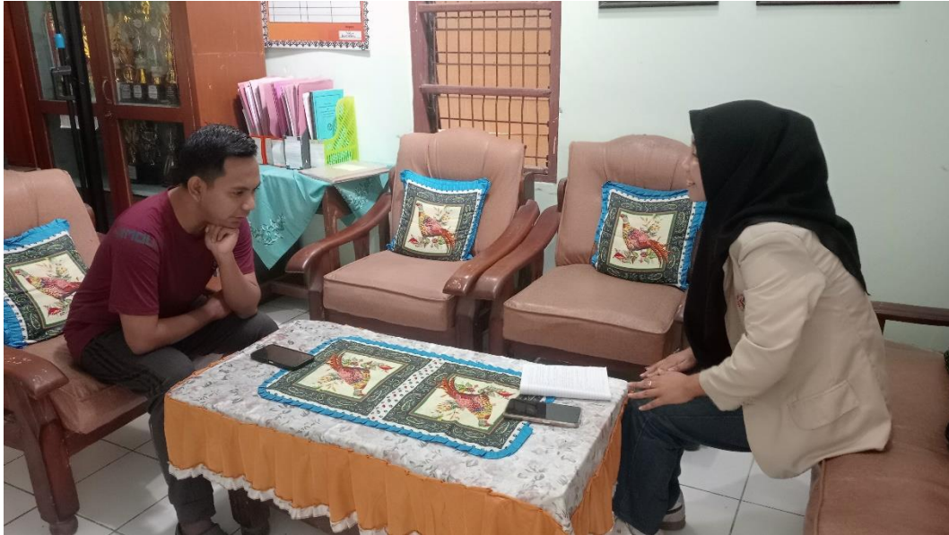
Gambar Dokumentasi Wawancara Wali Kelas